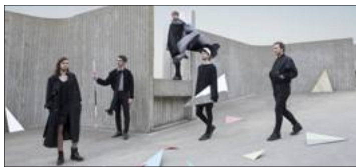
Les Canadiens de Mister Valaire et leurs influences électro, jazz, hip-hop et rock seront vendredi soir au Noumatrouff. Ils vous transporteront du Québec à Hawaï, de 1930 à 2090...