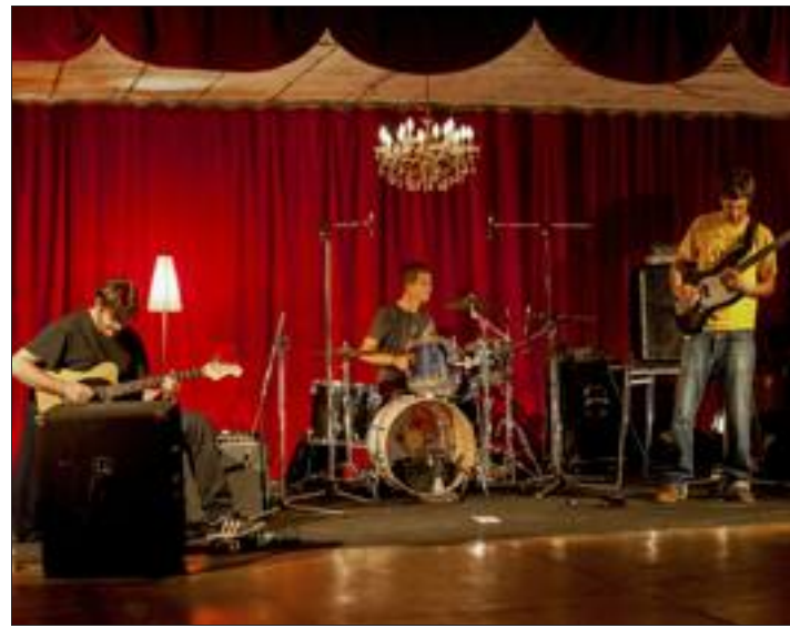
AMR.- Le nouveau lieu alternatif de Mulhouse, au parc de la Mer Rouge à Mulhouse, a convié dimanche dernier le power trio italien Squartet. Un combo affranchi de toute barrière musicale, qui a donné un concert unique et percutant.