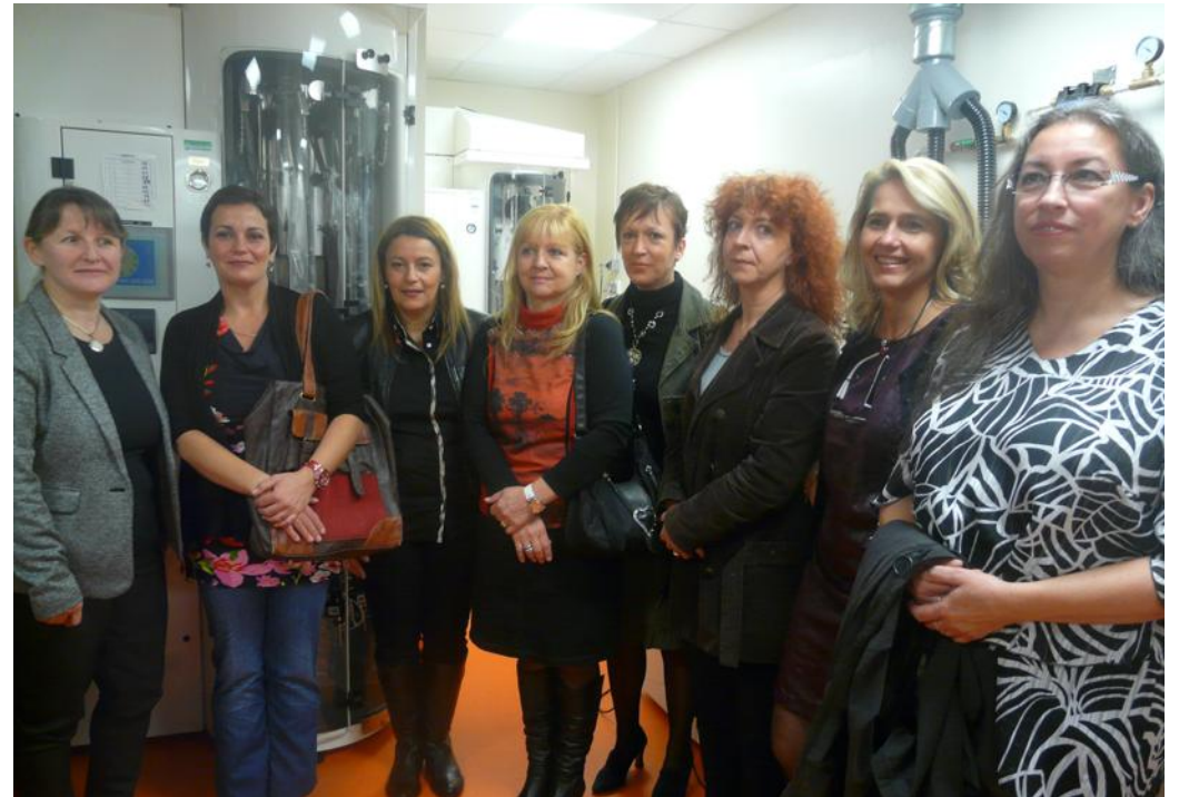
Une partie de l'équipe soignante dans la salle de lavage et de désinfection du matériel.

supposé être de retour chez dans les deux heures après l'intervention. « Il est accueilli, puis préparé pour subir son examen. » En principe sous anesthésie générale, il est conduit en salle d'examen, avant de rejoindre la salle de réveil. En parallèle, des techniciennes lavent, désinfectent, stérilisent et stockent le matériel utilisé. « Cet endroit est le poumon de l'endoscopie. Il occupe un emplacement stratégique », précise le gastro-entérologue. Les conditions de sécurité doivent être optimales. « L'essentiel du service d'en-