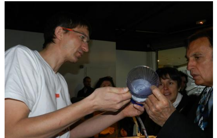
Pour faire tenir le filtre à café, une petite pièce a été fabriquée avec une imprimante 3D en deux heures.

Et ils savent comment confectionner et faire fonctionner une imprimante 3D. Un outil indispensable dans tous les foyers pour confectionner des pièces de toutes les sortes.