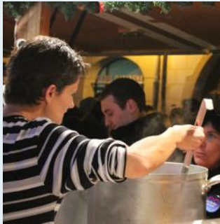
L'interdiction ne s'applique pas aux manifestations autorisées. Ici, le marché de Noël de Mulhouse.

Finie la cannette sur les bancs des parcs. La préfecture étend l'interdiction de consommer de l'alcool de 15h à 6 h sur la voie publique aux squares, au quartier Neppert, et à une partie du centre-ville.