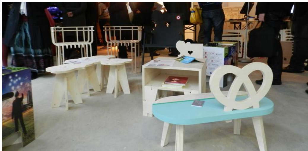
Des chaises imaginées par des artistes mulhousiens.