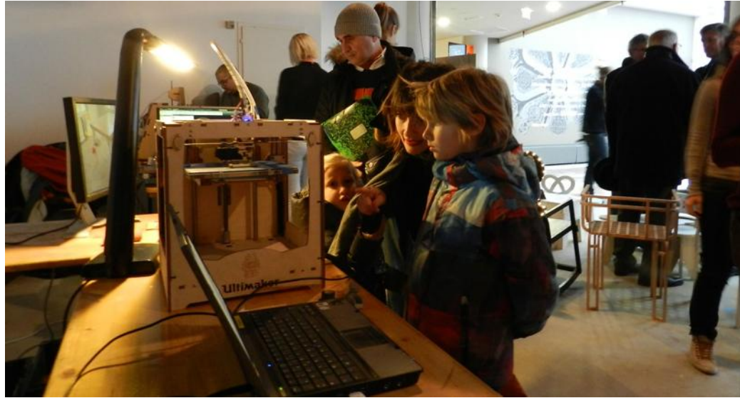
Devant l'imprimante 3D, la star du festival.

Il vous manque un bouchon de réservoir pour votre vieille Twingo, une pièce de votre portemanteau s'est cassée ? Une solution, l'imprimante 3D.